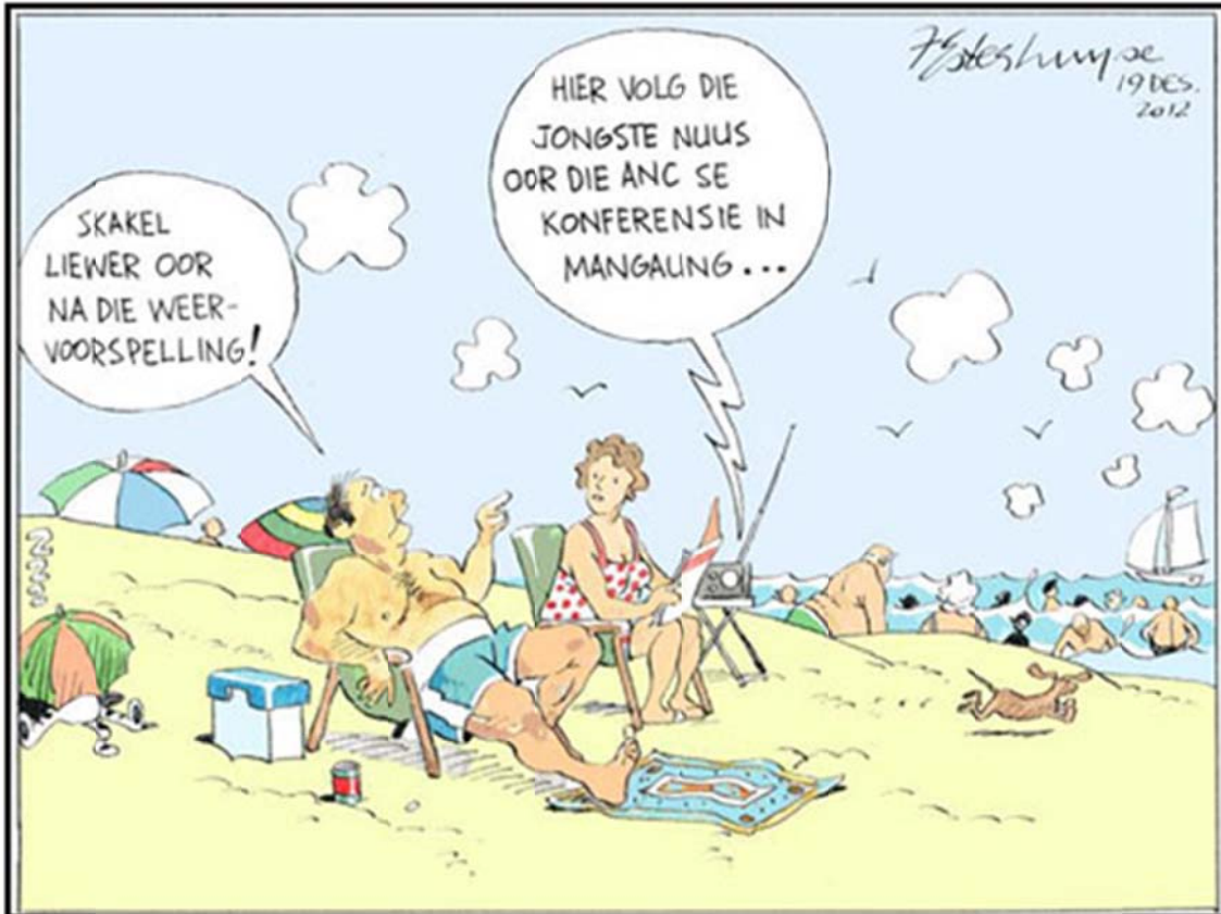
Beeld: 19 Desember 2012

Lees deur die volgende spotprent en beantwoord die vrae wat volg: